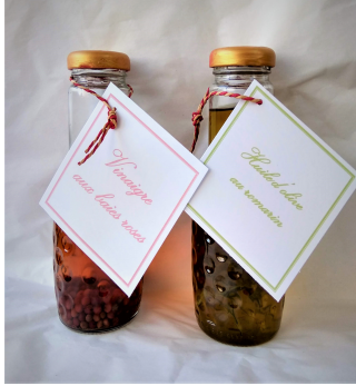
Vinaigre aux baies roses et huile au romarin Réf : Epi004 6€