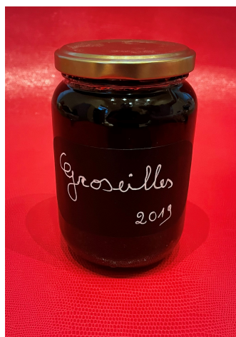
Groseilles 2019 Réf : Epi003 3€