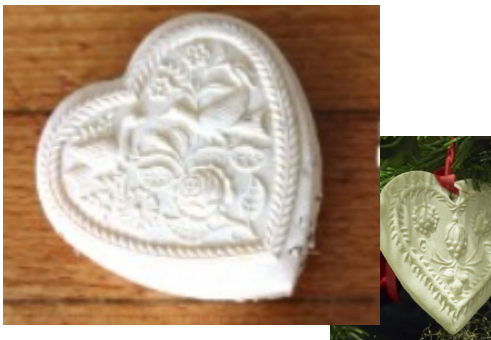
Springerle Ces biscuits alsaciens à l'anis se conservent longtemps et peuvent servir de décoration avant d'être dégustés Assortiment de différentes tailles et motifs (100g environ) Réf : Epi006 5€