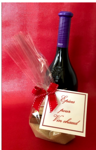
Kit à vin chaud Réf : Epi001 11€