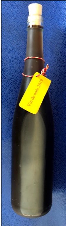
Vin de noix 2019 Réf : Epi005 13€